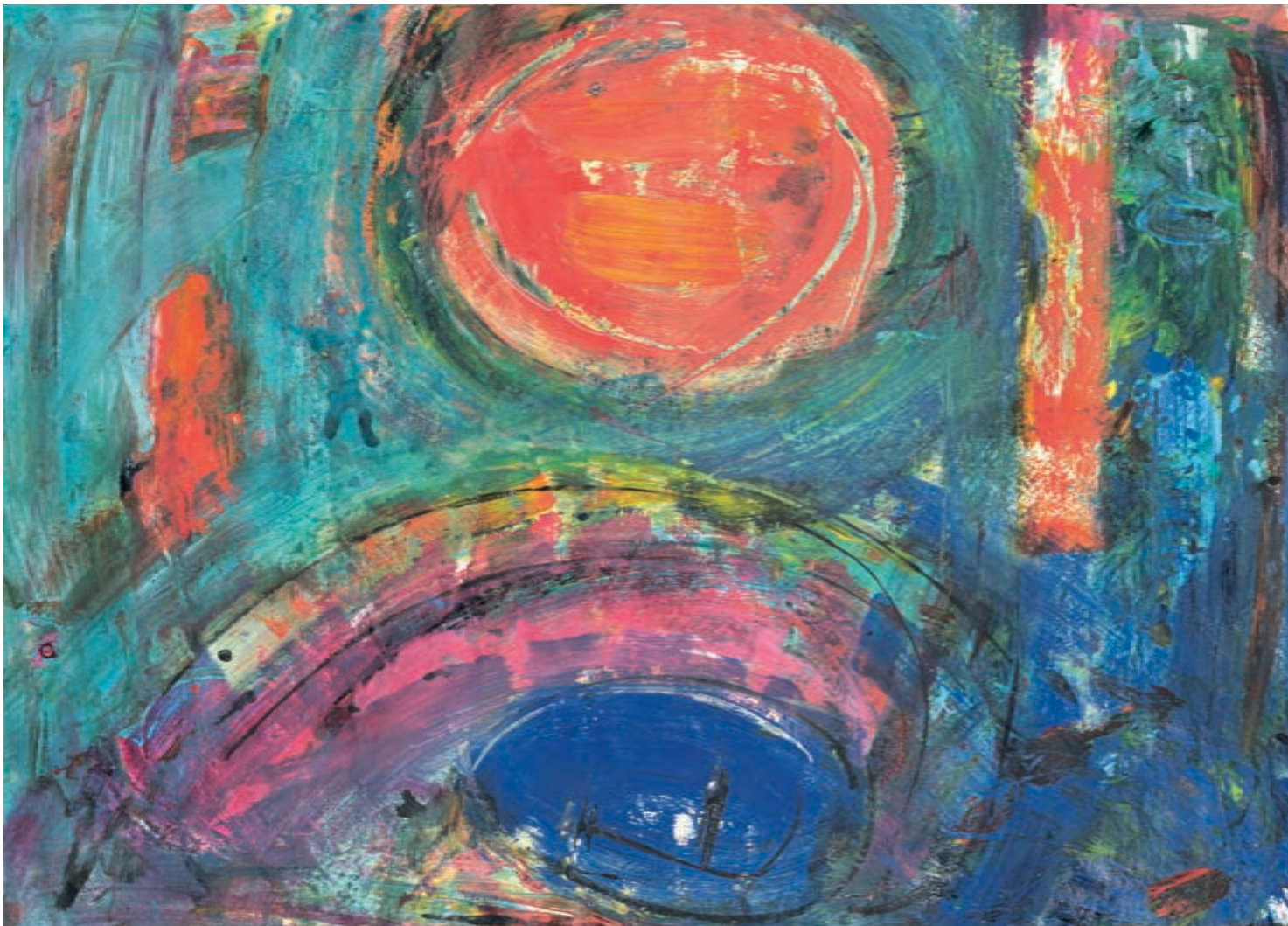
Anima mundi (Sofija). Akril na papirju, 500 x 700 mm, 2000.

desno: Angelska kozmofonija. Tuš na papirju, 210 x 297 mm, (dve variaciji), 1999.