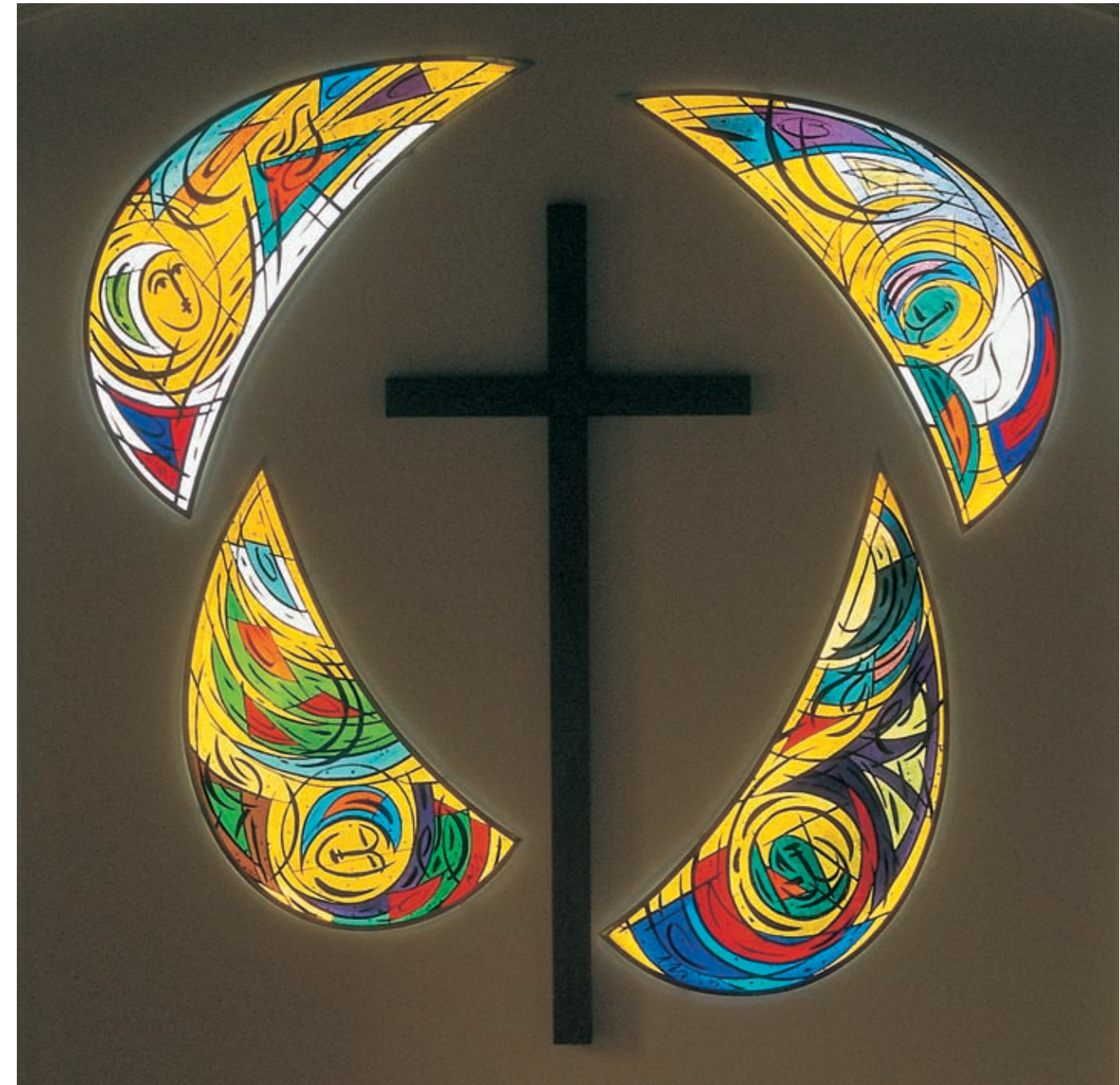
levo: Izvir - Ciklus - življenja . Kvartet barvnih oken nad oltarjem, 1996/97, evangeličanska cerkev sv. Pavla (Pauluskirche), Meckenbeuren, Nemčija.

Eno najbolj smelih slikarjevih del so prav gotovo štiri barvna okna na oltarni steni v evangeličanski cerkvi v Meckenbeurenu v Nemčiji. Velikanska oltarna stena je odprta v zaokroženo trapezoidno kompozicijo štirih polmesečastih likov, sredi katerih dominira križ. Umetnik je zasnoval celotno kompozicijo od same oblike oken in ikonografije do končne barvite vizije. Imel je popolno svobodo, ki jo je dobro upravičil. Uspelo mu je ustvariti to, o čemer piše sv. Janez v Razodetju: "Pred prestolom pa je bilo kakor stekleno morje, podobno kristalu" (Raz. 4,6). V