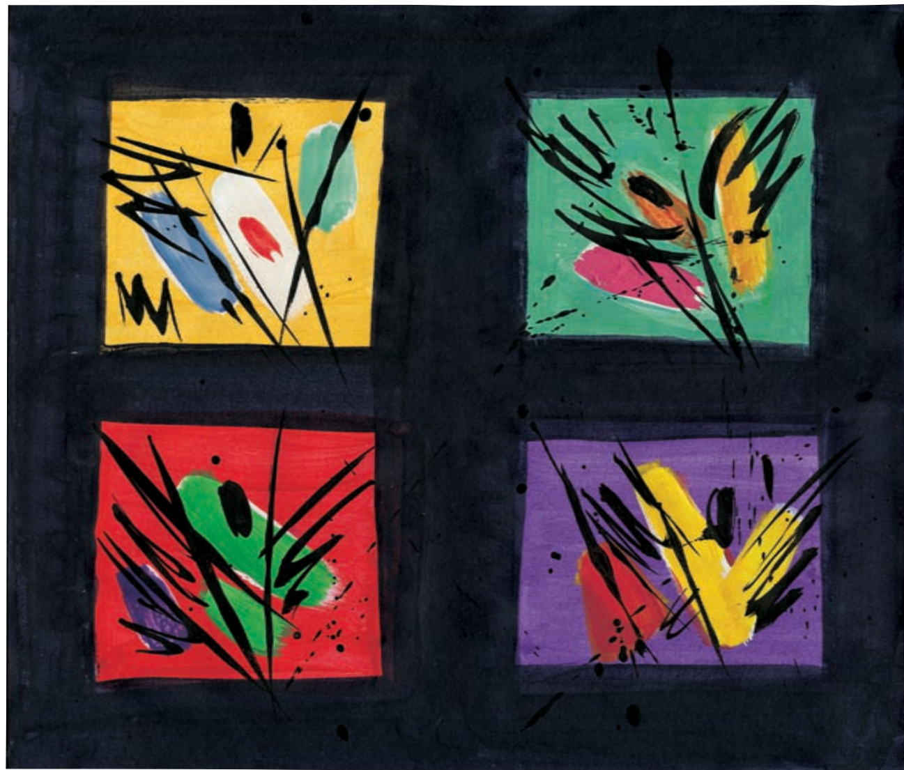
Kvartet za Messiaena (Poveličana telesa / Les Corps glorieux). Akril in tuš na papirju, 250 x 295 mm, 1999.