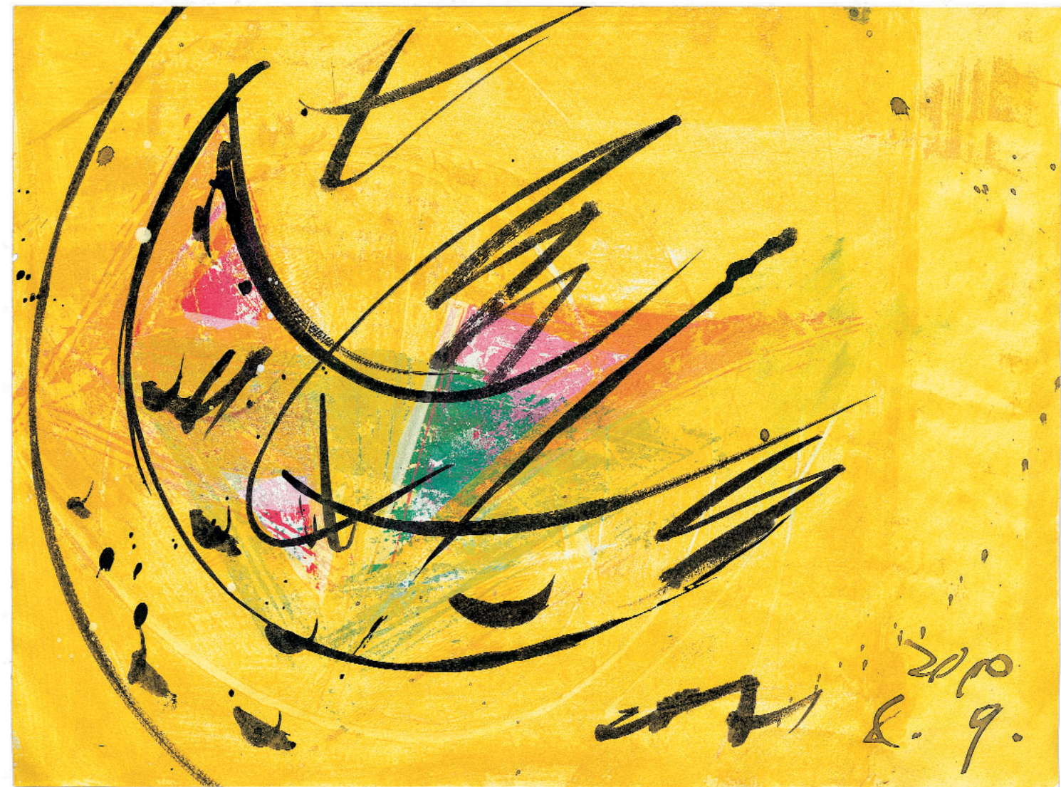
Čas ptice / Le temps de l'oiseau. Iz cikla: "Hommage à Messiaen", Akril in tuš na papirju, 210 x 297 mm, 2000.