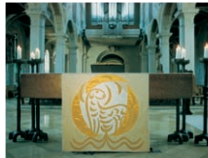
Agnus Dei. Biberach, 1993.