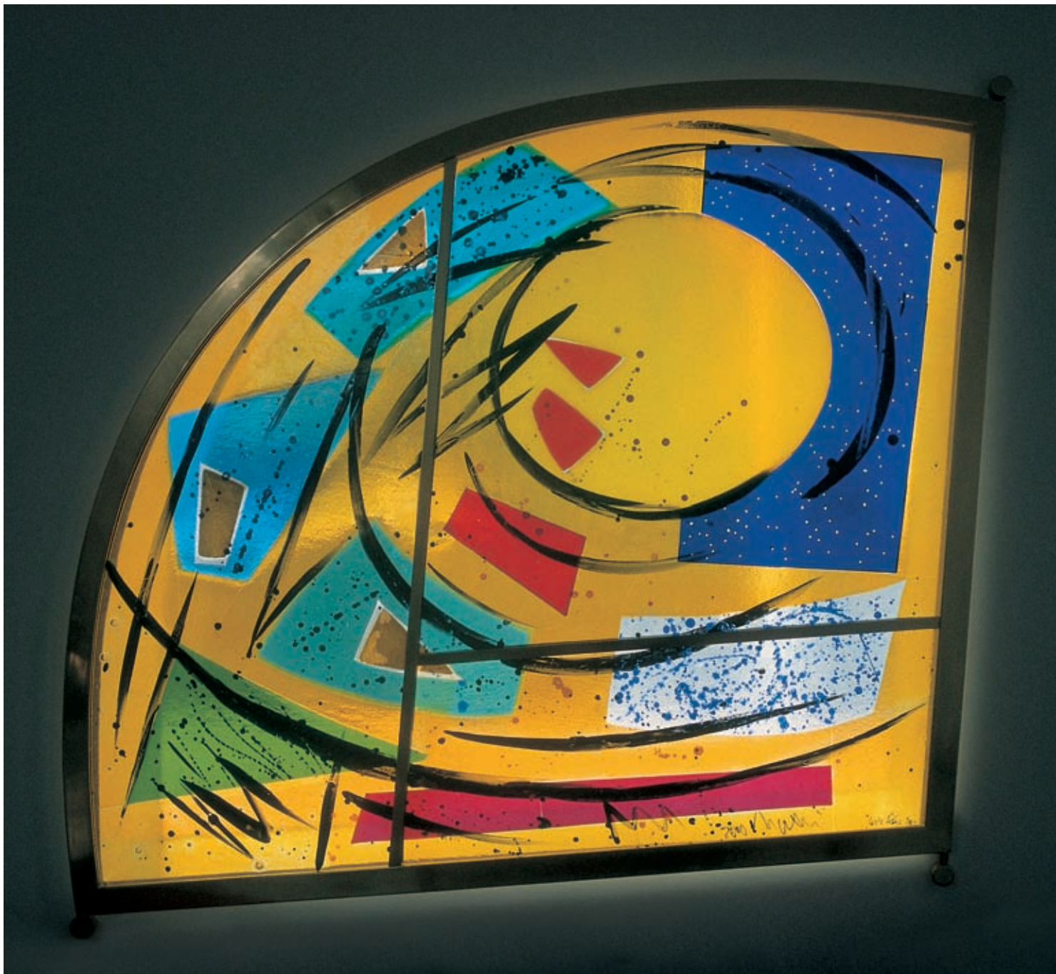
Prenavlajoči Duh stvarjenja. Vitraj, 2000/01 (dva detajla), kapela gimnazije Želimlje.