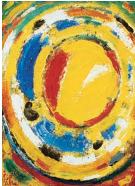
zgoraj: Sijaj Novega Jeruzalema (dvanajsta slika Biblijskega cikla). Akril na platnu, 70 x 50 cm, 1995/96.