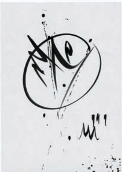
Vzgon duše - Srčni angel (Pinu Mlakarju). Tuš na papirju, 297 x 210 mm, 1999.