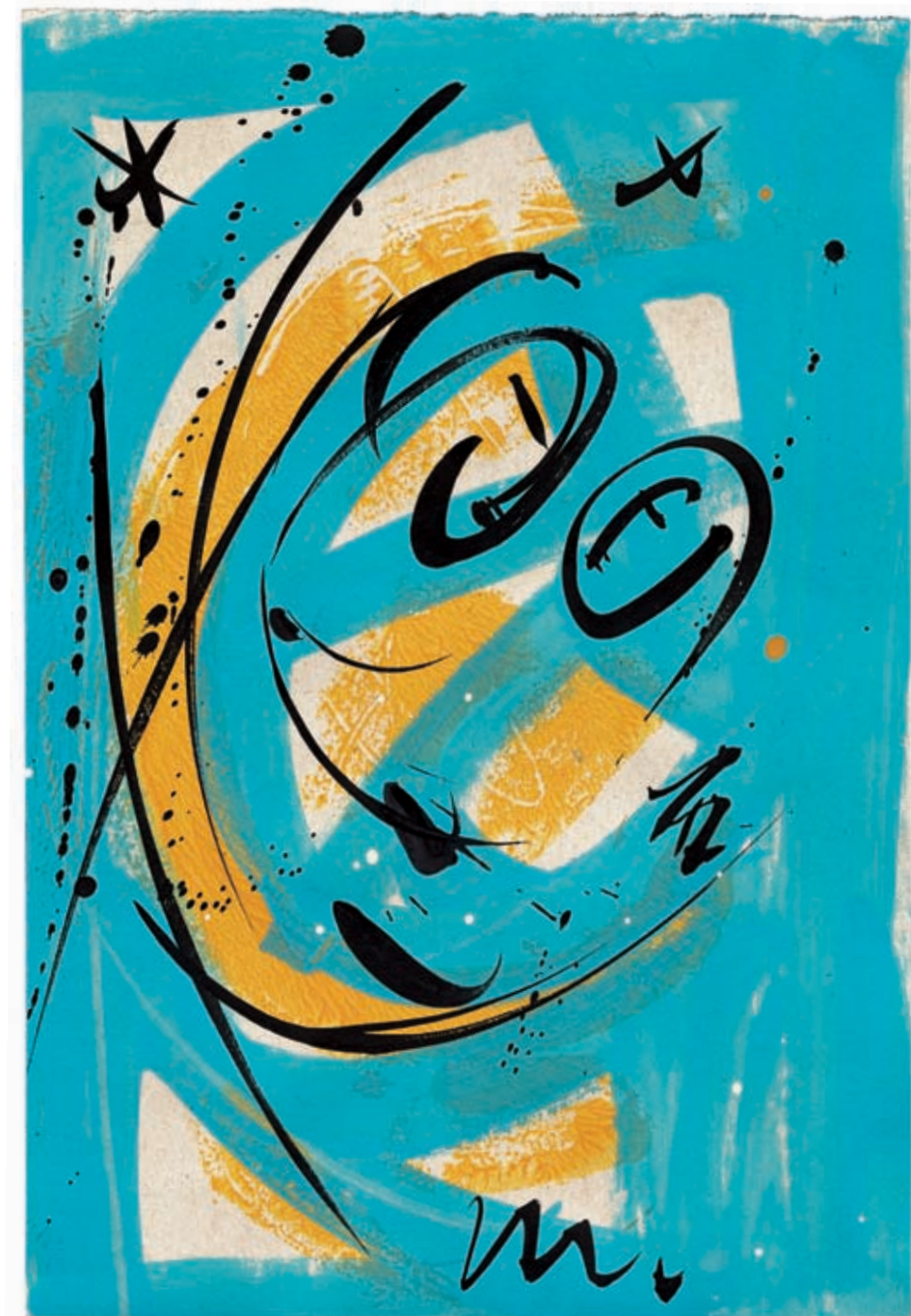
Objem (Visoka pesem). Akril in tuš na papirju, 340 x 230 mm, 2001.