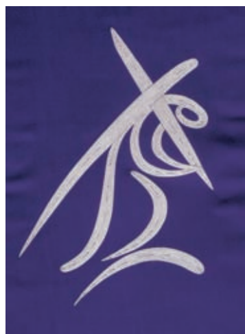
Vijolični antependij, detajl (Via crucis). Načrt 1999, izvedba 2000.

Evangeličanska cerkev sv. Mihaela (Michaelskirche), Gerstetten, Nemčija,