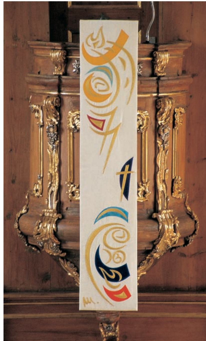
Beli antependij (Rojstvo in Vstajenje). Načrt 1998/99, izvedba 2000.