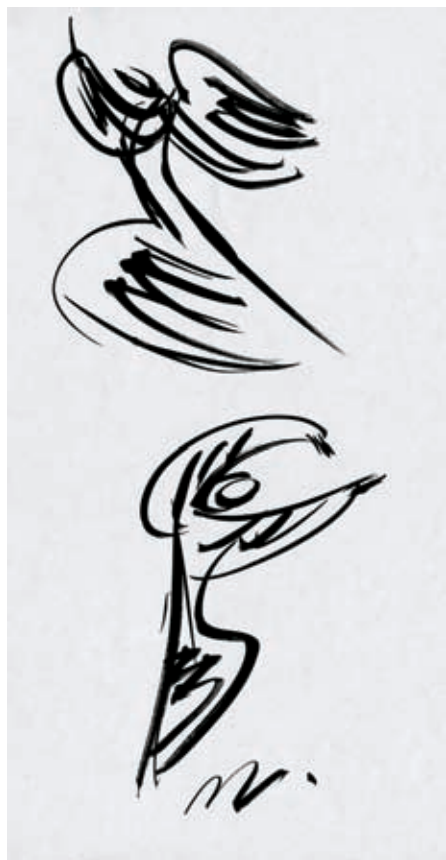
Jakob z angelom. Tuš na papirju, 1996.

Doživetja lepote v umetnosti se stikajo s krščanskim misterijem. Krhka tišina Rojstva, dramatični čudež stvarjenja, življenja in človeške ljubezni, boleči žar Trpljenja in temr Smrti, vse to najde svojo dopolnitev in preobrazbo v sijaju Vstajenja... Nenazadnje pa je tu še plameneči ples Duha, ki napolnjuje s stvariteljskim poletom in z novimi videnji.