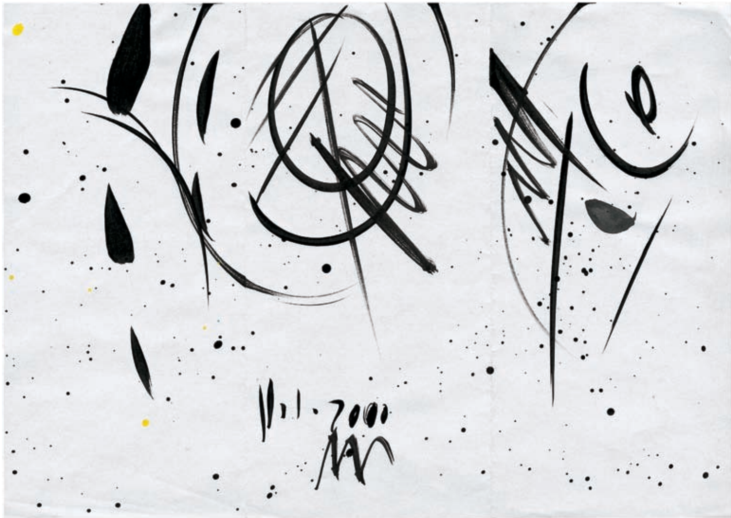
Ta "da", ki poje kakor odmev svetlobe... Ce oui qui chante comme un écho de lumière...

Olivier Messiaen: Tri male liturgije Trois petites Liturgies